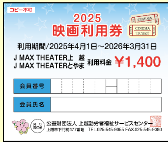
映画利用券 <年度内12枚>