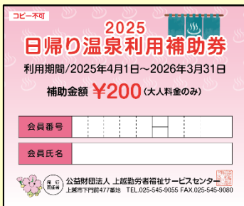
日帰り温泉利用補助券 <年度内12枚>