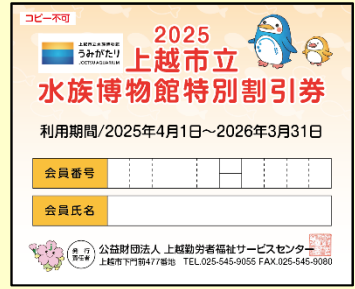
上越市立水族博物館割引券 <年度内6枚>

「さくちゃん補助券」・「東京ディズニーリゾート・コーポレートプログラム利用券」は補助券冊子にはありません。ホームページまたはさくちゃんガイドブック保存版 P.28 「利用申込書」より申し込みください。(限度枚数・補助額等に変更はありません。)